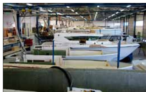
Delta Powerboats dispose de sa propre usine sur la côte ouest estonienne.