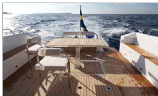
Le grand cockpit est pourvu d'une grande table optionnelle, dont le pied retractable lui permet d'être dissimulée dans le sol.

Deux écrans Raymarine de 17 pouces trônent en belle place devant la barre, en plus des divers moniteurs de contrôle. Le teck huilé et les tons clairs sont également de mise au niveau du pont inférieur. Et notamment dans l'immense cabine propriétaire, installée à l'avant du bateau. Dotée d'un lit king size, la profusion de teck et les vaigrage blanc cassés lui confèrent une ambiance design et douillette, tandis que quatre grandes ouvertures zénithales lais-