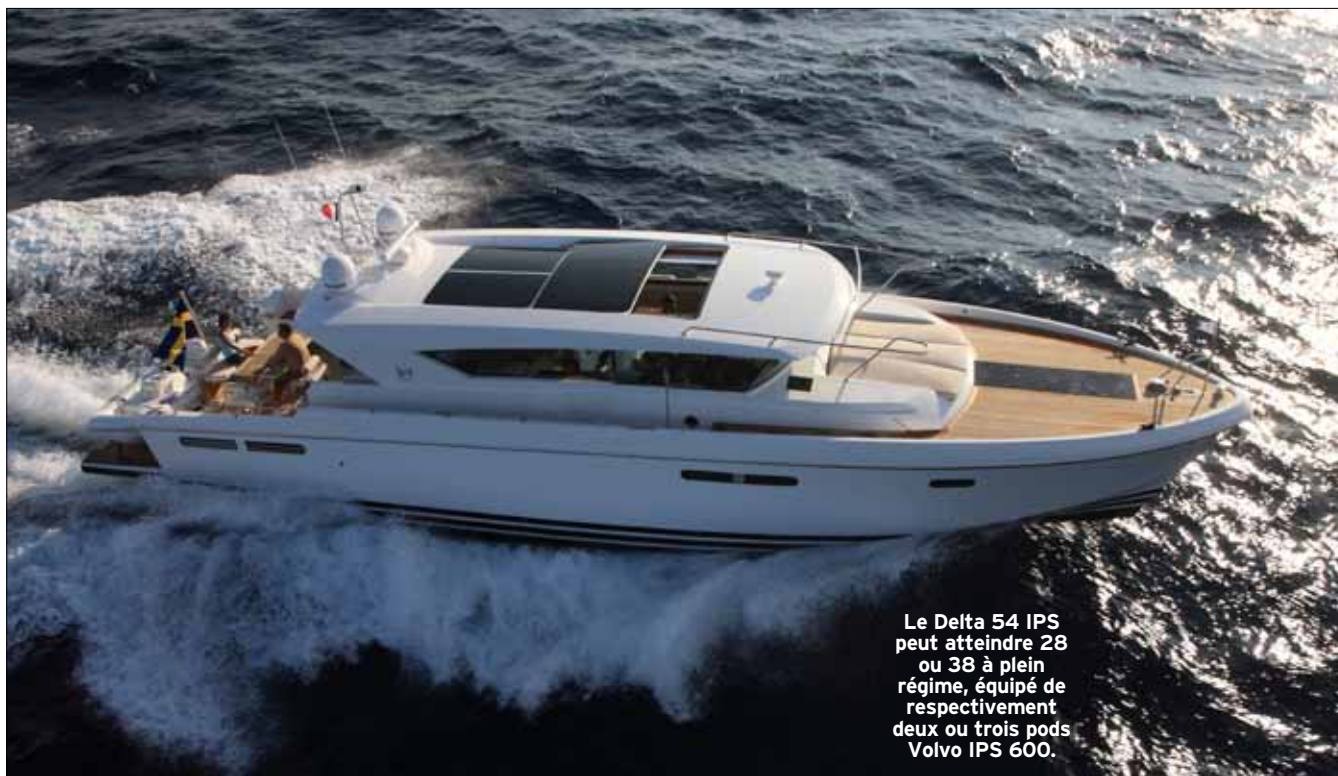
Le Delta 54 IPS peut atteindre 28 ou 38 à plein régime, équipé de respectivement deux ou trois pods Volvo IPS 600.